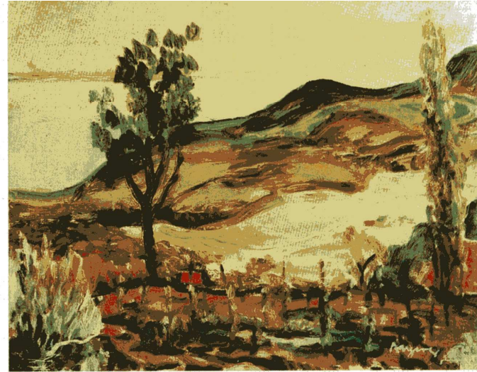
A káptalanfüredi domb